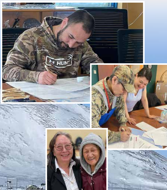
Figure 3 : Succès de la tournée des communautés 2023 de la Commission d'aménagement de la région marine du Nunavik (CARMN).