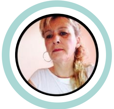
ἄρῳ ἰσχυρὰ ἔσῃ ἄρῳ ἰσχυρὰ ἔσῃ ἄρῳ ἰσχυρὰ ἔσῃ