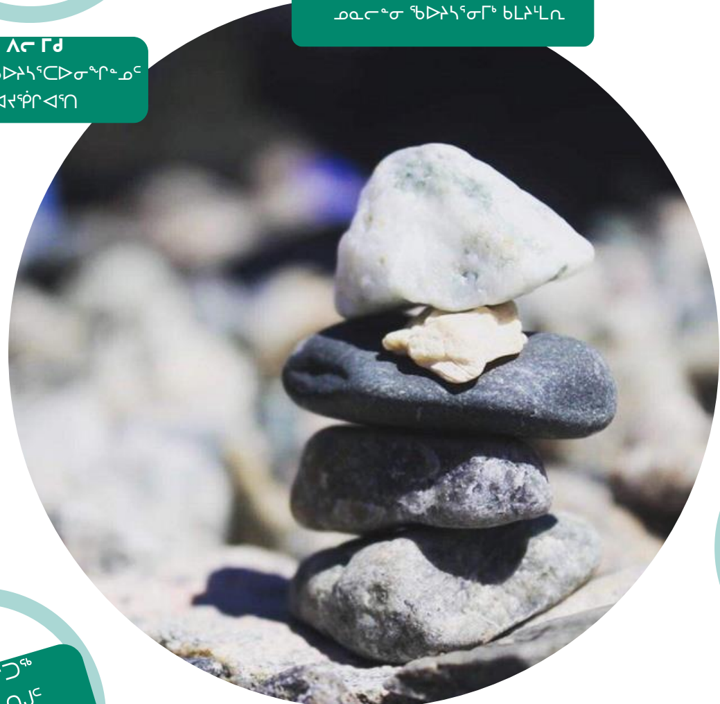
ἄρῳ ἰσχυρὰ ἔσῃ ἄρῳ ἰσχυρὰ ἔσῃ ἄρῳ ἰσχυρὰ ἔσῃ