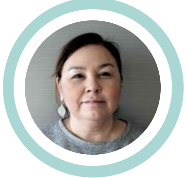
ἄρῳ ἰσχυρὰ ἔσῃ ἄρῳ ἰσχυρὰ ἔσῃ ἄρῳ ἰσχυρὰ ἔσῃ